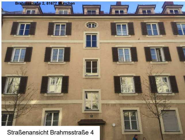
Straßenansicht Brahmsstraße 4