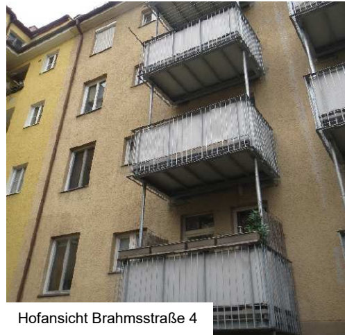
Hofansicht Brahmsstraße 4