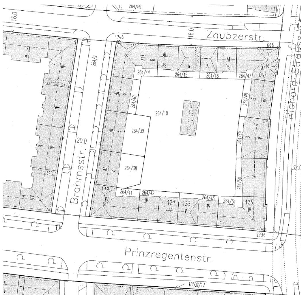
Auszug aus der Liegenschaftskarte

Gemeinde: 81677 München, Brahmsstraße 2 und 4 Gemarkung: Bogenhausen Grundbuch: München, Band 82 Blatt 2349/08.12.1998 Flurstück / Größe: Brahmsstraße 2: 264/38 410m 2 Brahmsstraße 4: 264/39 495m 2