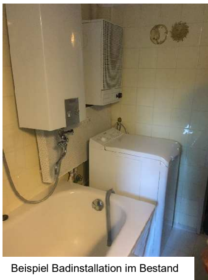
Beispiel Badinstallation im Bestand